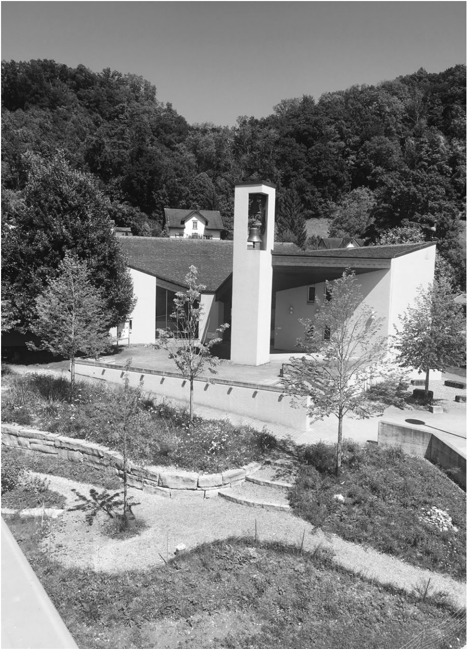
Neugestaltete Umgebung Kirchenzentrum Kradolf